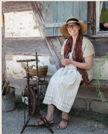
Handspinnerin bei der historischen Handwerksvorführung an der Schäferei aus Hambühl

Am historischen Trittwebstuhl wird gezeigt, wie durch den Rhythmus von Pedalen und dem fliegenden Webschützen aus feinen Fäden echtes Leinen entsteht. Zentimeter um Zentimeter wächst der Stoff als mechanisch gefertigtes Kunstwerk.