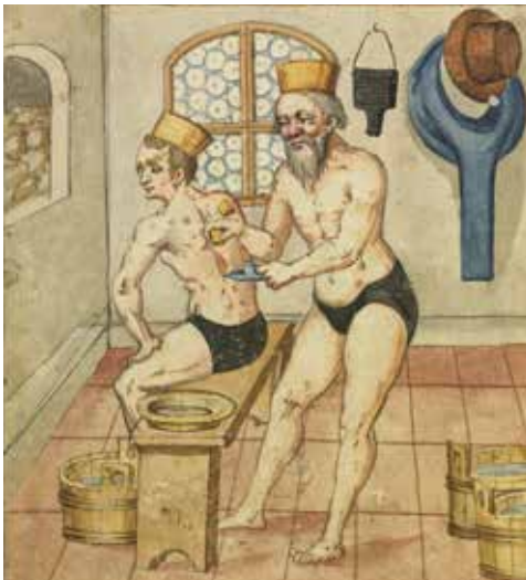
Schröpfszene in einer Badstube: Der Bader Wolff Geigenfeindt setzt dem Badegast Schröpfköpfe am Rücken an. Links im Bild ist ein Teil des großen Schwitzofens mit Badsteinen zu sehen; Stadtbibliothek im Bildungscampus Nürnberg, Amb. 317b.2 o , f. 80v.

Ausstellungs- scheune aus Betzmannsdorf, Erdgeschoss