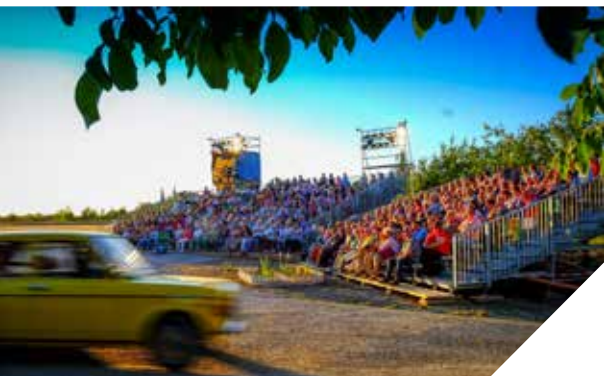
Szenen aus dem Sommerstück des Freilandtheaters »Vollgas« 2015.

Die Bäuerin Katharina Berner ist verzweifelt: ihr Hof soll zwangsversteigert werden. In einem allerletzten Versuch, ihre Existenz zu retten, wendet sie sich an den Großbauern Hofer, der sich schon lange für ihr Land interessiert. Doch dann kommt alles ganz anders als gedacht... Das Sommerstück »Alles kein Wunder« zeigt, dass manchmal Hilfe dort herkommt, von wo wir es am wenigsten erwarten.