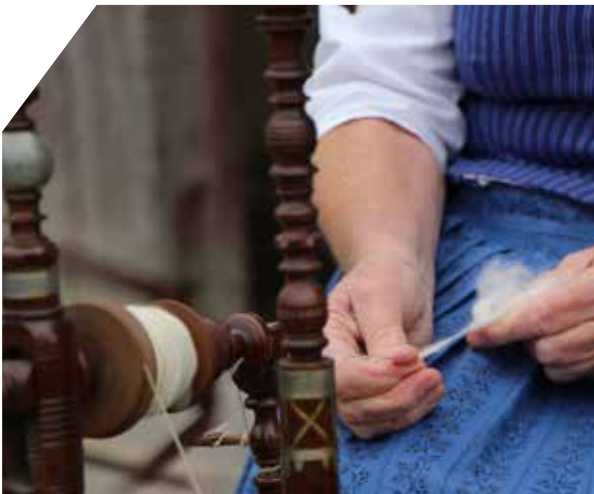
Spinnen mit dem Spinnrad.