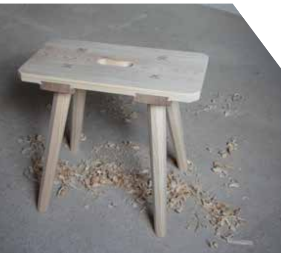
Ein mögliches Ergebnis des Kurses »Mit Hobel und Säge«.