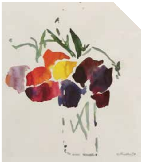
Oskar Koller, Die Liebe, Aquarell, 1993, Oskar- Koller-Stiftung.