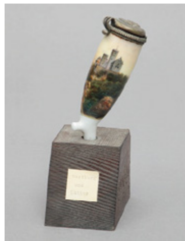
Pfeifenkopf mit Wartburg-Motiv (Privatsammlung Friedrich Kaeppel)