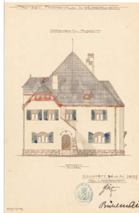
Bauzeitlicher Plan des 1907 erbauten Pfarrhauses in Weimersheim (BayHStA, OBB 14735)

D er Besucher begegnet in Bild-, Text- und Tondokumenten zahlreichen historischen Pfarrhausbewohnern Frankens und erfährt so u. a. von den gelehrten Interessen vieler Pfarrer wie auch von Aufgaben und Herausforderungen der Pfarrfrau und der Pfarrerskinder. Inszenierungen einzelner Räume wie der Studierstube und der Guten Stube mit zahlreichen authentischen Exponaten aus Privatbesitz geben Einblick in die besondere Wohnsituation im historischen Pfarrhaus – in einem privaten und in gewisser Weise doch immer auch öffentlichen Umfeld.