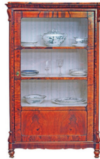
Vitrinenschrank aus dem Haushalt von Pfarrer Wilhelm Drechsel (Privatsammlung Friedrich Moll)