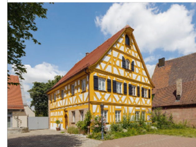
Pfarrhaus von Großgrundlach, erbaut 1669

In der Ausstellung wird so die große Vielfalt des evangelischen Pfarrhauses in Franken in seiner nun mehr 500-jährigen Geschichte gezeigt.